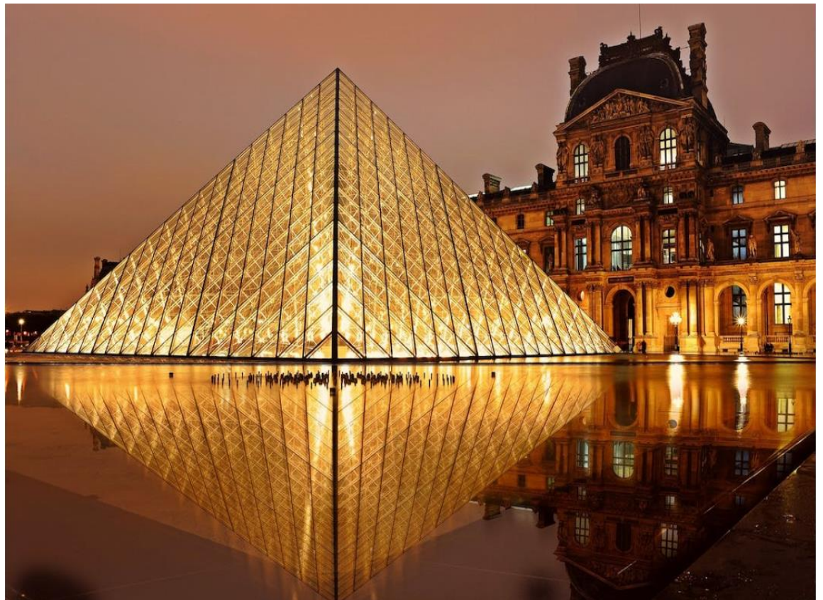
La photo du mois : Pyramide du Louvre (Paris, France)

- La fidélité : Ici, la loyauté des étudiants, la continuation des études avec French Rêve.