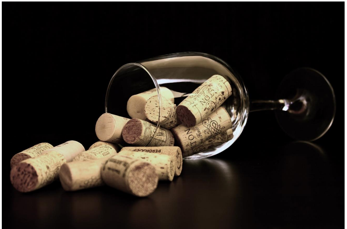
La photo du mois : Plaisir du vin et bouchons de Liège

- 'Faire un petit clin d'œil à' : 😊 Expression idiomatique = un petit coucou / un petit bonjour / une référence positive à quelqu'un ou quelque chose.