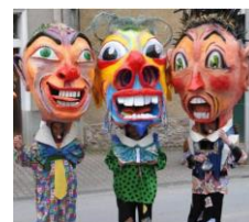
'Grosses têtes' de Nice