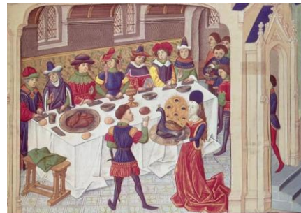
Résolutions : Enluminure représentant le banquet du paon, milieu du XVe siècle. Le Livre des conquêtes et faits d'Alexandre, Paris, musée du Petit-Palais.

Aussi longtemps que je suis mes stratégies, je pense que je réussirai ! Bonne chance pour vos nouvelles résolutions !