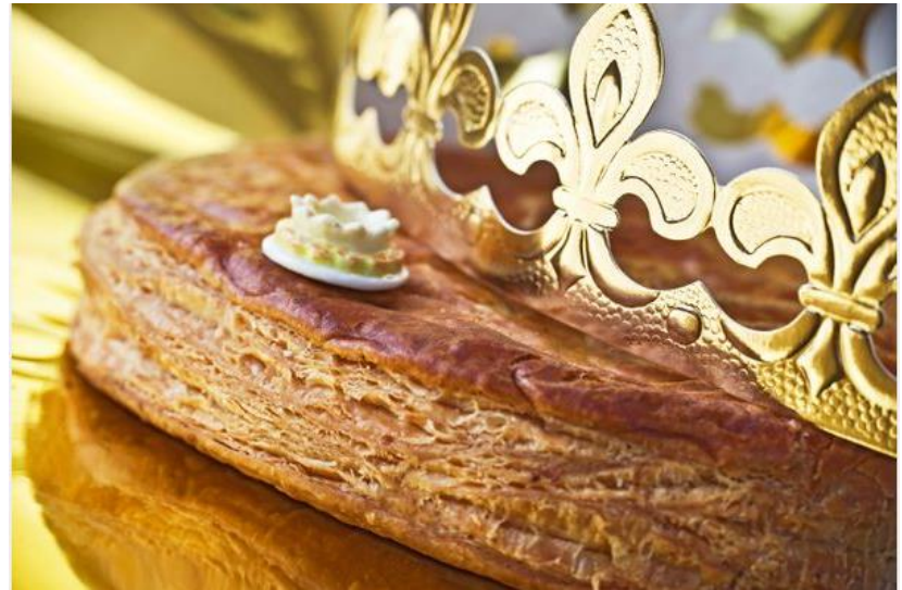
La galette des Rois, classique, à la frangipane.

A déguster à l'occasion de l'Épiphanie, début janvier. Attention au petit objet en porcelaine caché à l'intérieur : La fève qui fait le bonheur des dentistes ! 😊😄