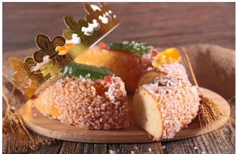
La galette des Rois briochée, aux fruits confis.

Ces deux recettes sont très faciles à réaliser.